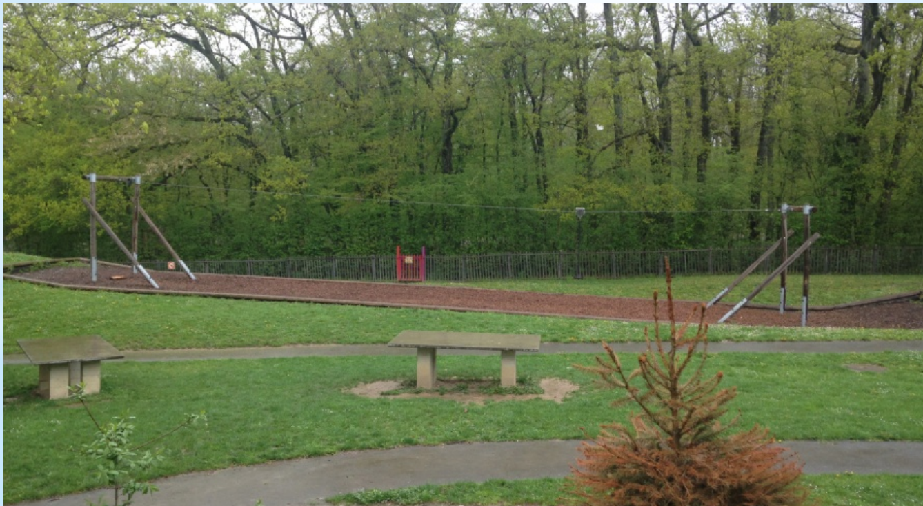
Terrain d'aventure d'Onex