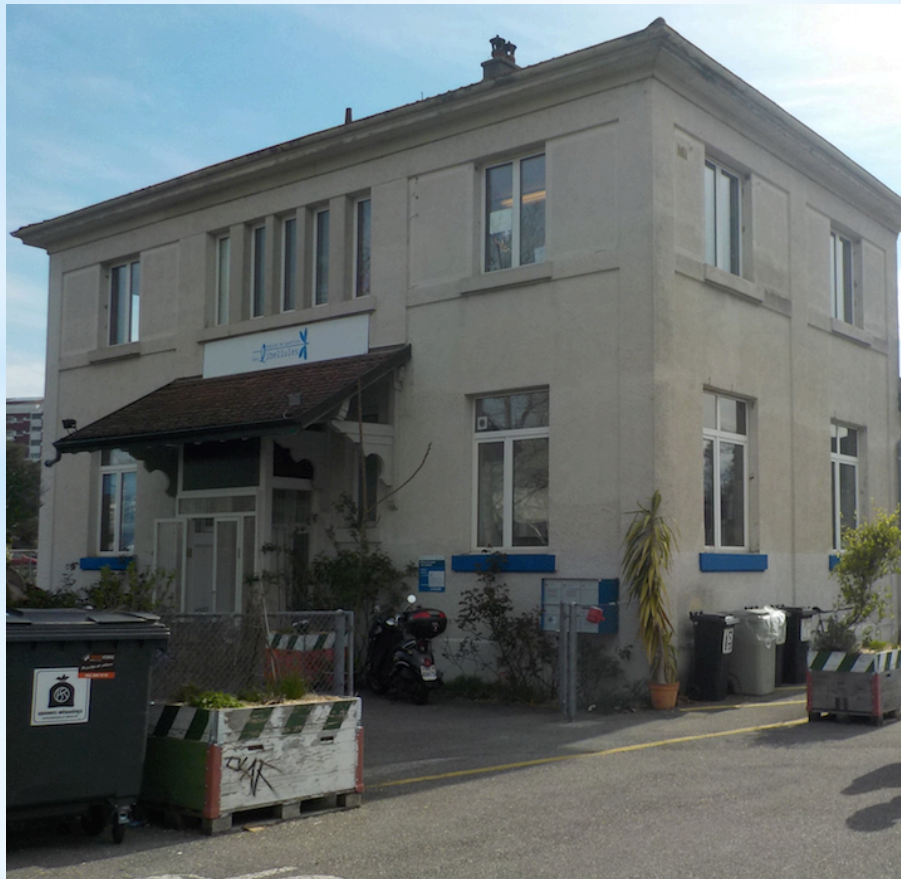
MQ des Libellules